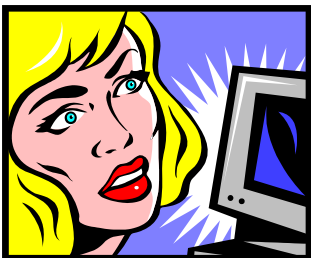
Intresserad av att få EndoNytt via e-post?

möter behovet av information till stödgrupper, patientföreningar, patienter och liknade över hela världen. Här publiceras artiklar skrivna av kvinnor som delar med sig av sina egna "endo-erfarenheter" vilket kan vara till stöd för andra kvinnor i liknande situationer. Dessa artiklar får man kopiera, översätta och återdistribuera utan speciellt tillstånd. Alla förfrågningar om artiklar skickas till lone@endozone.org .